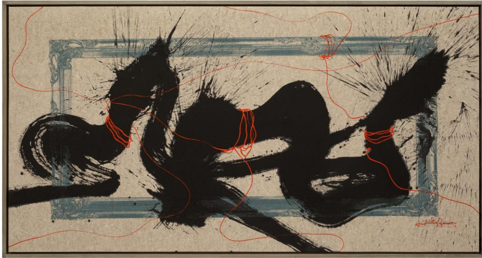
秦風,《偉大者的肖像 54》, 壓克力絲棉紙本, 160 x 306 厘米 (70 x 120 1/2 寸)

秦風的作品獨具其個人風格，他強烈表現力和姿態美的筆觸配合豐富的繪畫工具，創造出一種獨一無二的表現語言，以演譯他對文明、哲學、神秘論和語言的見解。他經常手製專屬自己的紙本，一種混合了絲綢、棉布、亞麻布和米紙的紙；把巨大紙本於地上展開和站在它上面，揮著超大的毛筆蘸上黑色水墨大氣磅薄、渾勁有力地橫掃和點墨，在紙本上自由奔放。在《偉大者的肖像》系列，秦風在他的紙本上以 19 世紀西方藝術表現形式 — 鍍金畫框的既有形象作為實驗對象，只用黑色和紅色有力的筆觸填補空白空間。這些書法，轉化成人性化的筆觸，在傳統的畫框畫出抽象的肖像，創造出一個能兼容東西雙方和諧的對話。幼細的紅線象徵貫穿古與今、生與死和看似存在著不同文化的引線或脈絡。