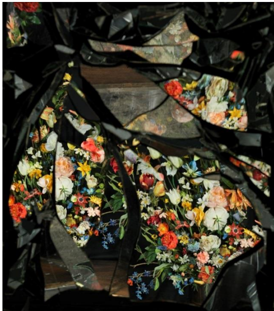
奧里·格斯《鏡花緣：融匯 B05》(2014)；鐳射列印；100x87 公分 / 39 \frac{3}{8} x 34 \frac{1}{4} 吋；版數：6 +2 AP