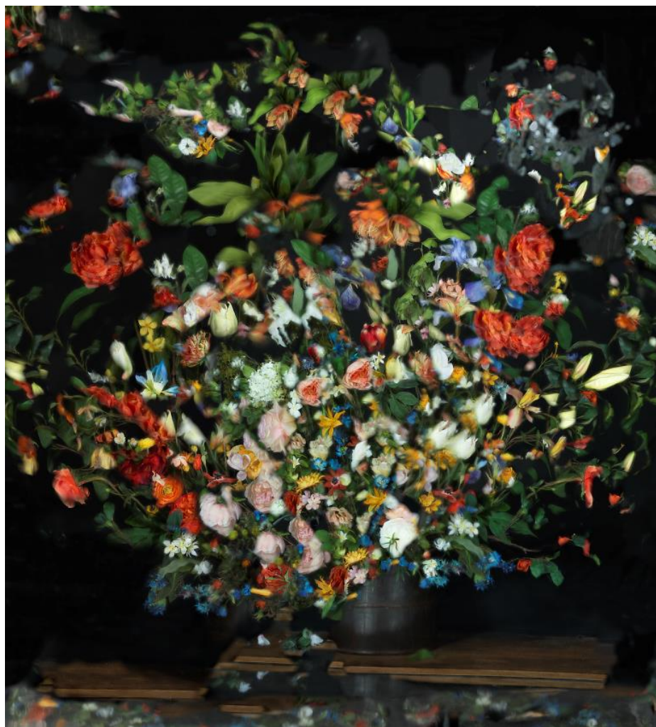
奧里·格斯《鏡花緣：虛擬 E01》(2014)；鐳射列印；199 x 180 公分 / 78 ¾ x 70 ¾吋；版數：6 +2 AP